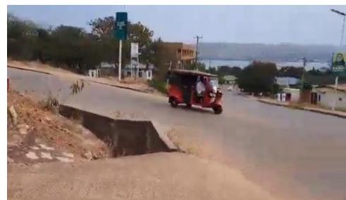
En sortant du studio, dans le fond, on aperçoit le lac Tanganyika.