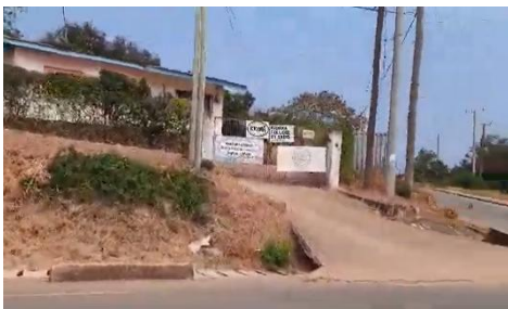
L'entrée du studio de Kicora