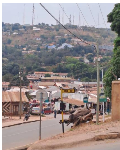
Vue sur Kigoma en sortant du studio. Sur la colline d'en face, toutes les antennes dont celle de Kicora.

Voici des nouvelles de la radio Kicora : des exemples d'émissions au fil des jours, la suite de l'histoire du conteneur avec panneaux solaires et batteries, la santé de Déo et puis les activités de l'asbl Kicora belge.